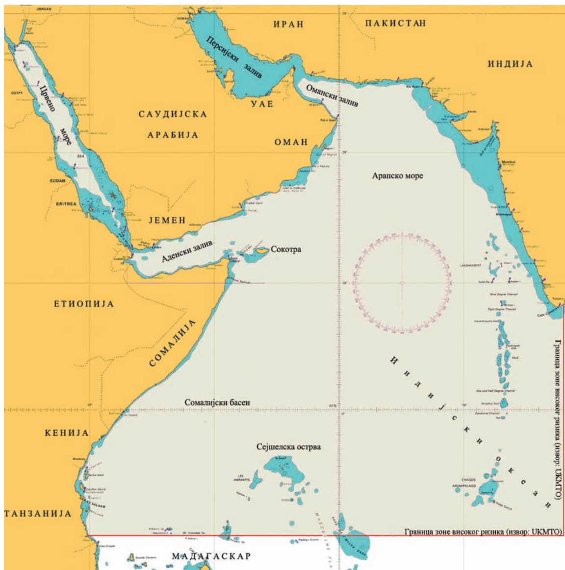
Зона подручја деловања сомалијских пирата

сазвао специјални представник за Сомалију у новембру 2008. године, у сомалијским водама делује неколико пиратских група. Две главне групе, идентификоване у извештају генералног секретара у марту 2009. године, биле су пиратска мрежа која је базирана у регији Пунтланд, дистрикт Ејл и пиратска мрежа у региону Мудуг, дистрикт Харардера. Такође, мање пиратске групе делују око сомалијских лука Босасо, Квандала, Калула, Баргал, Хобио, Могадишо и Гарад.