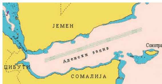
Препоручени међународни транзитни коридор (IRTC) кроз Аденски залив

Оба пловна пута у коридору широка су по пет наутичких миља са међузонам ширине две наутичке миље. 4 Пловни пут према западу налази се на северном делу коридора и одвија се у курсу 072°, а према истоку на јужном делу коридора, у курсу 252°.